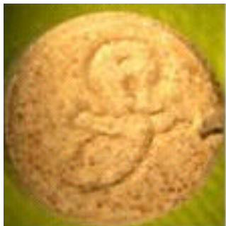
Ecstasy-Pille „Kasper“ mit dem Wirkstoff PMA

Die Europäische Beobachtungsstelle für Drogen und Drogensucht E.B.D.D. (European Monitoring Centre for Drugs and Drug Addiction E.M.C.D.D.A.) warnt vor dem Risiko des Konsums von „Ecstasy-Pillen“ mit dem Logo „Kasper“ oder „Kasper der Geist.“ Diese Pillensorte enthält 36 mg PMA. Dem Vernehmen nach sollen noch 100.000 Pillen dieser Prägung auf dem Schwarzmarkt innerhalb der Europäischen Union kursieren.