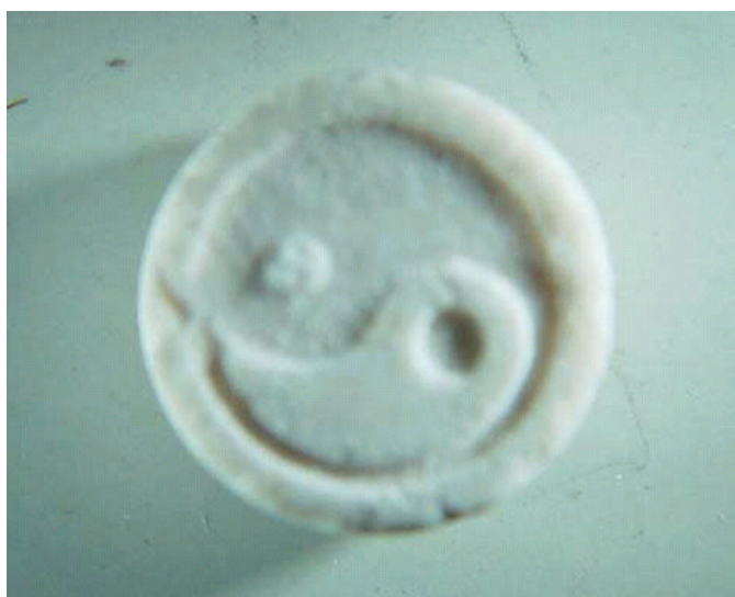
Ecstasy-Pille „Ying-Yang“ mit den Wirkstoffen MDMA+PMA

In Thun, Kanton Bern, tauchte in Juni eine „Ecstasy-Pille“ mit dem Ying-Yang-Symbol auf, die außer 32,6 mg Methylen-Dioxy-Methyl-Amphetamin (MDMA) den Wirkstoff Para-Methoxy-Amphetamin (PMA) enthielt. Eve & Rave Schweiz warnt eindringlich vor dem Konsum dieser Lebensgefährlichen Pillensorte.